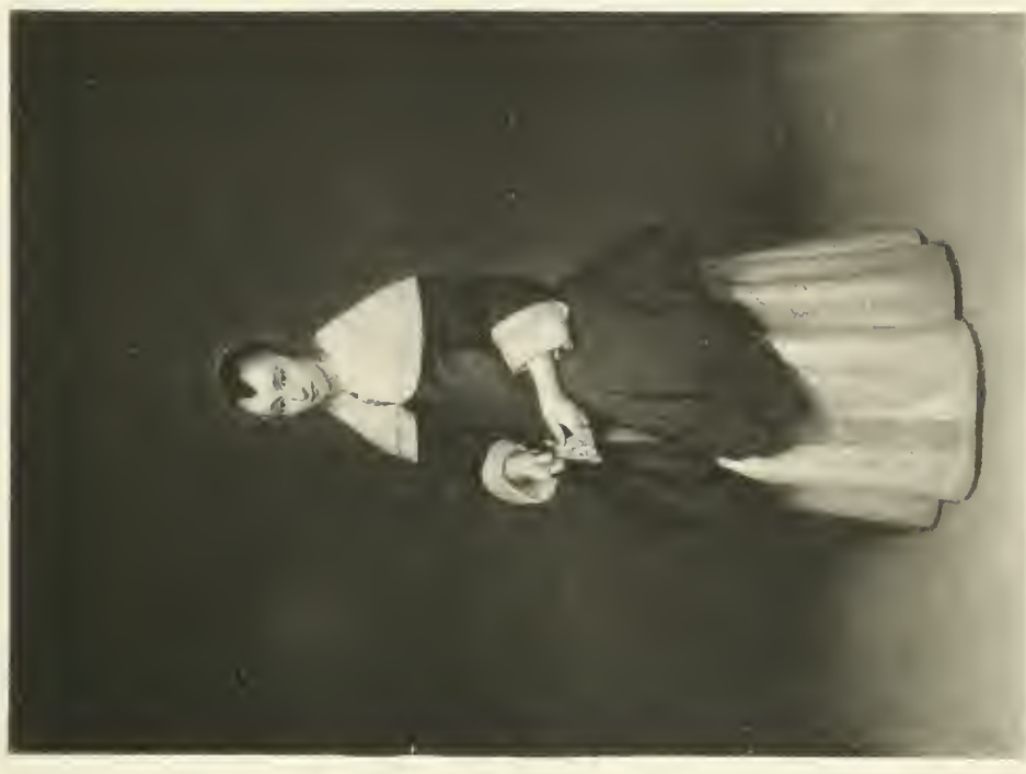
G. TER BORCH